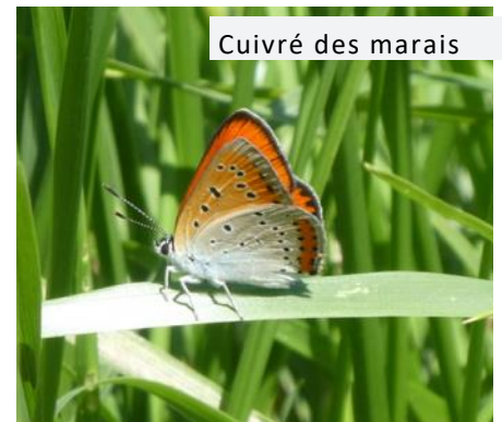
Cuivré des marais

L'ADASEA du Gers suit donc dans le cadre de cette évaluation, 3 prairies inondables du site Natura 2000 à Montesquiou. Ces suivis ont notamment permis d'observer le Cuivré des marais et le Damier de la succise, 2 espèces protégées et d'intérêt communautaire.