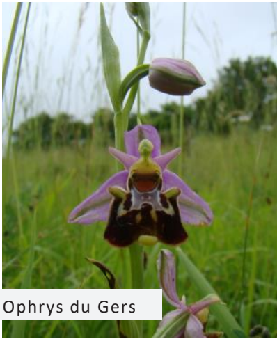
Ophrys du Gers

Lors des périodes d'animations précédentes (2020 et 2021), l'Adasea du Gers a réalisé des inventaires d'orchidées sur les milieux secs (pelouses, landes,...). Ces inventaires ont été faits sur 10 sites déjà étudiés en 2009. L'objectif de ces nouveaux relevés, 11 ans plus tard sur les mêmes zones, est de suivre l'évolution des milieux et d'analyser l'effet de la gestion.