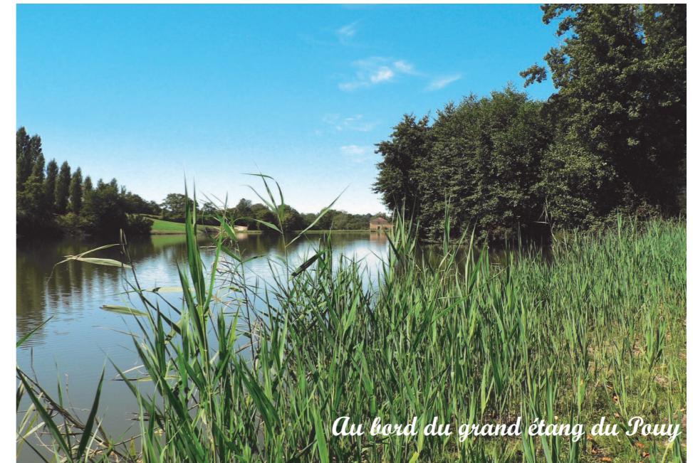
Au bord du grand étang du Pouy

Retrouvez les actualités du site natura 2000 sur internet http://gers.n2000.fr/