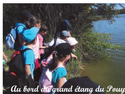
Au bord du grand étang du Pouy

Après une présentation du dispositif Natura 2000, du site Natura des « Etangs d'Armagnac », et de sa richesse faunistique et floristique, les trente participants locaux ont pu observer des cistudes, des libellules ainsi que de nombreux indices et traces animales. Une balade en forêt a permis de découvrir plusieurs espèces végétales.