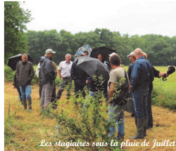
Les stagiaires sous la pluie de Juillet

N'hésitez pas à contacter l'ADASEA du Gers.