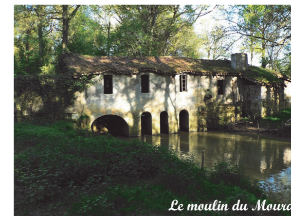
Le moulin du Moura

Un chantier école est prévu sur 4 ans, de Mai à Août, en collaboration avec le Conseil d'Architecture, d'Urbanisme et de l'Environnement (CAUE) du Gers, pour restaurer le moulin du Moura selon l'emploi de techniques et de matériaux semblables à ceux d'origine.