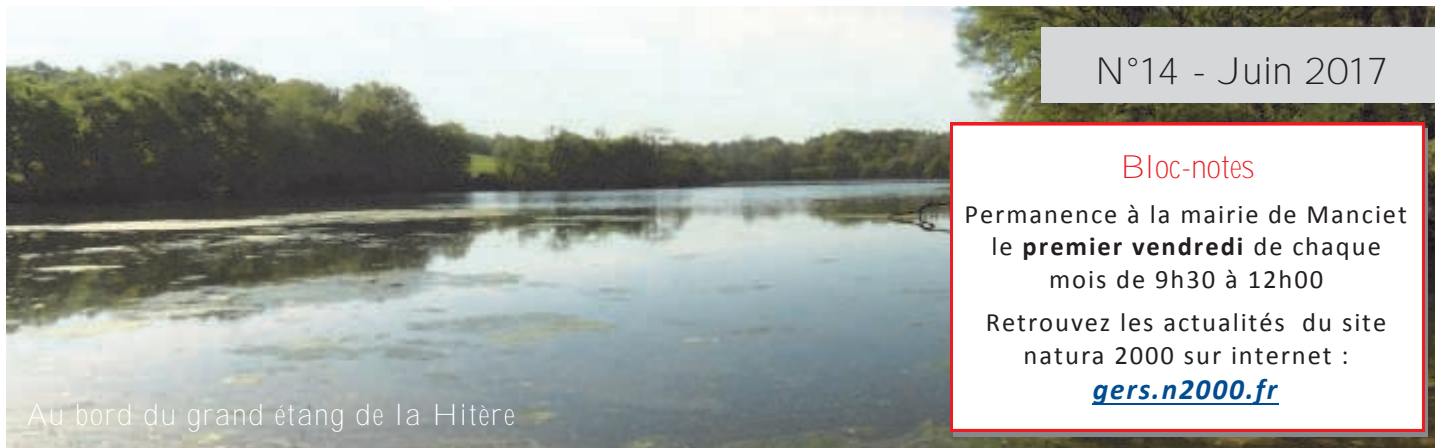
Au bord du grand étang de la Hitère