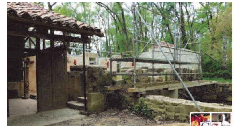
Dossier suivi par Nicolas Bernadidou au Conseil Départemental

Le partenariat avec le CAUE pour la restauration du moulin du Moura continue cette année. Après avoir rénové la moitié du bâtiment en 2015 et 2016, les stagiaires du CAUE ont attaqué les travaux sur le troisième quart depuis le 12 avril avec l'atelier démolition (enlèvement de la toiture). Les trois quarts du moulin seront donc intégralement remis à neuf d'ici le 12 octobre.