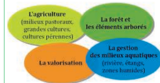
Thématiques des groupes de travail